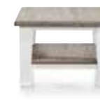
Beistelltisch 1-Nische, B/H/T 60/40/60 cm