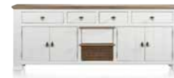
Sideboard 4-Türen + 4-Laden + 2-Körbe, B/H/T 240/91/45 cm