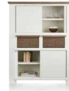
Schrank 2-Schiebetüren + 4-Nischen + 2-Körbe, B/H/T 130/161/45 cm