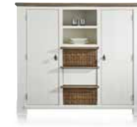
Highboard 2-Türen + 2-Nischen + 3-Körbe, B/H/T 163/140/45 cm