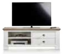
TV Sideboard 2-Laden + 2-Nischen, B/H/T 150/52,5/42 cm