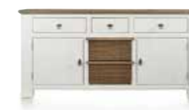
Sideboard 2-Türen + 3-Laden + 2-Körbe, B/H/T 190/91/45 cm