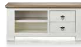
TV Sideboard 2-Laden + 2-Nischen, B/H/T 120/52,5/42 cm