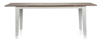
Ausziehtisch (+50 cm in der Mitte) B/H/T 160-210/77/100 cm