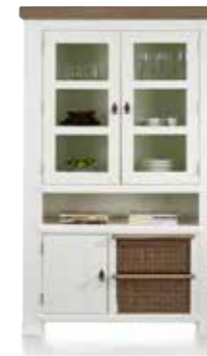
Vitrine 2-Glastüren + 1-Tür + 1-Nische + 2-Körbe, B/H/T 124/200/48 cm