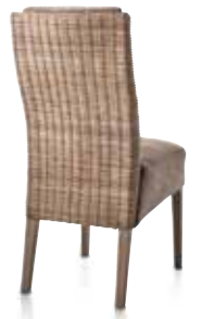
Stuhl Livra Fuss wagon grey - Bezug Canyon lava, B/H/T 47/99/70 cm