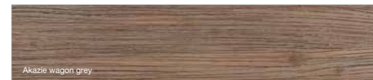
Akazie wagon grey