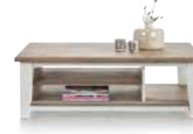
Couchtisch 3-Nischen, B/H/T 120/40/65 cm